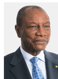
H.E. Professor Alpha Condé, President of the Republic of Guinea, Coordinator of renewable energies for Africa and Chair of the AREI Board

“Through the support and guidance of AREI, African countries are set to ensure universal access to people-centred energy for all their communities and move straight to renewable energy systems and zero carbon futures.”