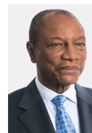
S.E. Prof. Alpha Condé Président de la République de Guinée, Coordinateur de l'UA pour les énergies renouvelables et Président du Conseil de d'administration de l'AREI

"Grâce au soutien et aux conseils de l'AREI, les pays africains doivent assurer un accès universel à l'énergie pour le bien-être de tous les citoyens et communautés en adoptant directement des systèmes d'énergie renouvelable et sobre en carbone dans le futur."